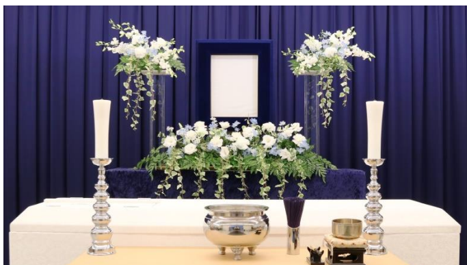
ブルー系 2段（正面から）