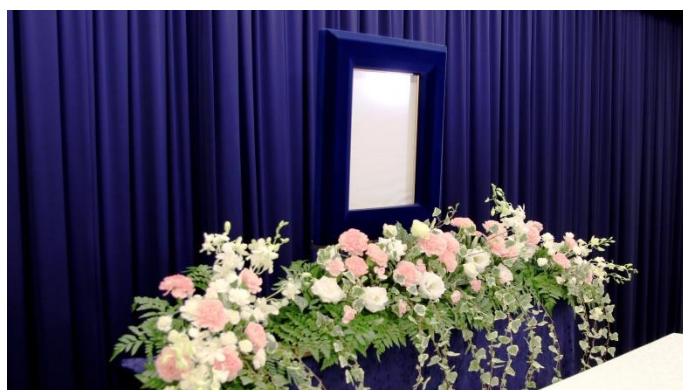
ピンク系 1段（斜めから）

ブルー系の1段、ピンク系の2段タイプもございます いずれのタイプも差額なくお選び頂けます