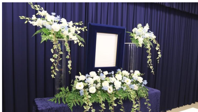
ブルー系 2段（斜めから）