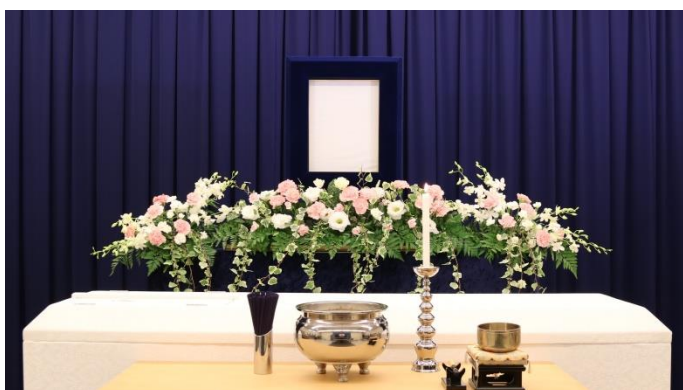
ピンク系 1段（正面から）